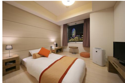
< フローリングタイプのレディースルーム >