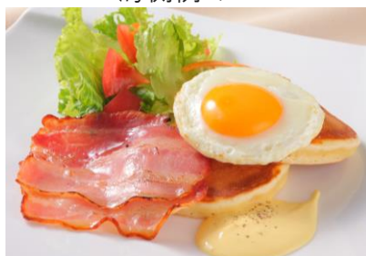
< パンケーキベネディクト >