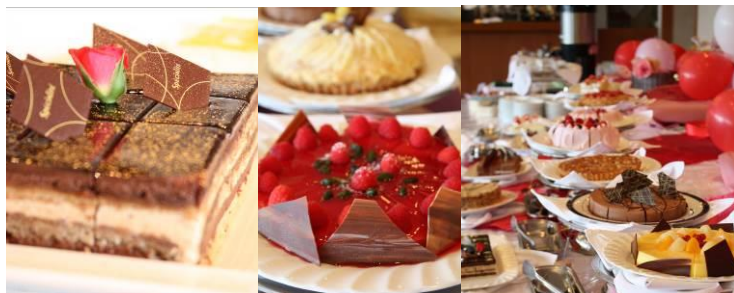
ラウンジ「アゼリア」 デザートバイキング「スイスフェア」11/1(土)・2(日)・22(土)・23(日) 4日間限定