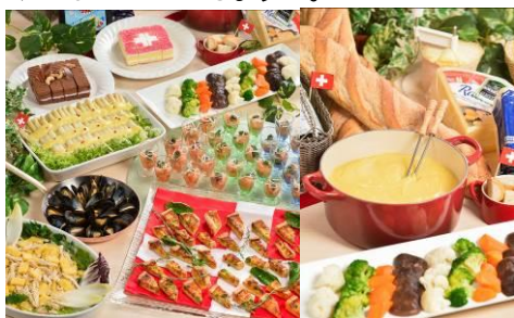
レストラン「グランヴェール」 スイスフェアを開催 ～11/30 まで

この機会にぜひ、山々が色づく紅葉の秋に、サン・モリッツと箱根の共通点「山・湖・鉄道・温泉・料理」を味わってみてはいかがでしょうか。