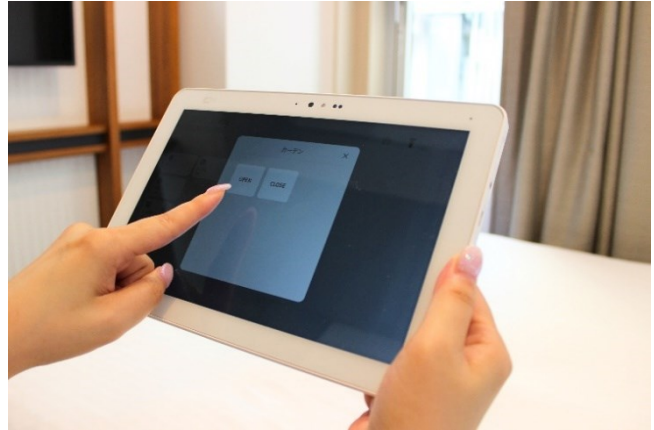
タブレットによる操作（イメージ）

今回のリニューアルでは、「Luxury compact（ラグジュアリー コンパクト）」をコンセプトに掲げ、空間を有効活用した客室の中に、銀座の街に溶け込む上質な佇まいと、先進的な機能性の両立を目指しました。