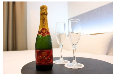
スパークリングワイン（イメージ）

さらに、お客さまにより充実した時間をお過ごしいただけるよう、美容ブランド「ReFa」のヘアドライヤー「ReFa BEAUTECH DRYER S+」および高機能シャワーヘッド「ReFa FINE BUBBLE U」を設置するほか、客室内にはウェルカムドリンクとしてスパークリングワインをご用意いたします。