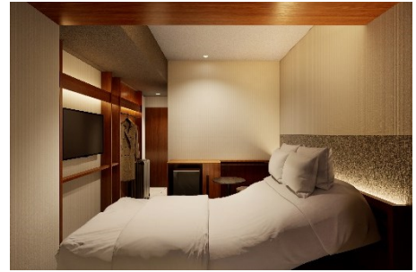
エグゼクティブフロア スマートダブル（イメージ）

客室名称 エグゼクティブフロア スマートシングル 客室数 4 室 広さ 14.8 m 2 定員 1 名 料金 38,500 円～（消費税・サービス料込、宿泊税別）