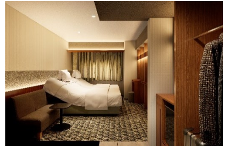
エグゼクティブフロア スマートハリウッドツイン（イメージ）

客室名称 エグゼクティブフロア スマートダブル 客室数 72 室 広さ 15.2 m 2 定員 2 名 料金 38,500 円～（消費税・サービス料込、宿泊税別）