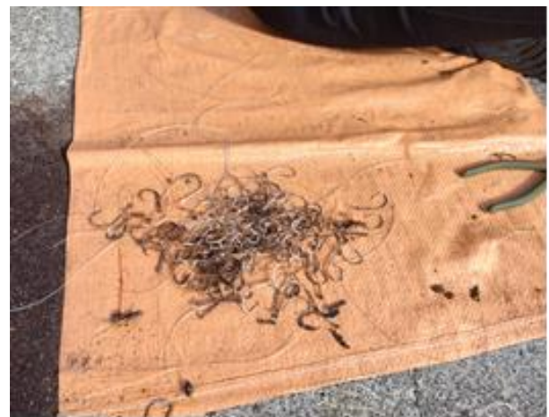
処理後のサルカンなどの金属