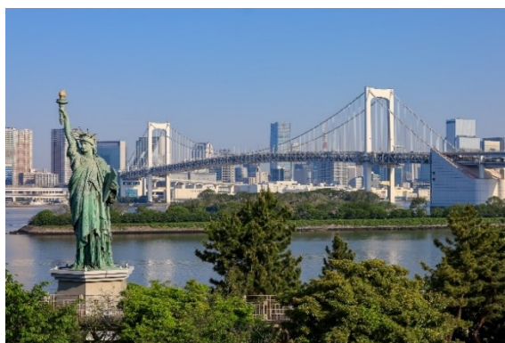
東京ベイエリアの夏（イメージ）

「＼SNSで繋がろう／フォトコンテスト」シリーズは、2022年6月から横浜桜木町ワシントンホテル公式 Instagram で毎月開催し、これまでの該当応募総数は累計で9,000枚を超える人気企画です。今回、横浜と同じベイエリアを繋ぐ新たな取り組みとして、「＼SNSで繋がろう／夏をめぐる、2つのベイエリア横浜&東京ベイ有明スペシャルフォトコンテスト」を実施いたします。募集テーマは「横浜の夏」と「東京ベイエリアの夏（お台場・有明・豊洲）」です。ご応募いただいた作品は、各ホテルで2作品ずつ選出し、多くの国内外の人々が訪れるホテルロビーで1カ月間展示いたします。また、副賞として入選作品が展示されるホテルとは異なる、もう一方のホテルでご利用いただける宿泊招待券を贈呈いたします。宿泊体験を通じて、それぞれのベイエリアの魅力に触れながらワシントンホテルでの特別なひとときをお過ごしください。