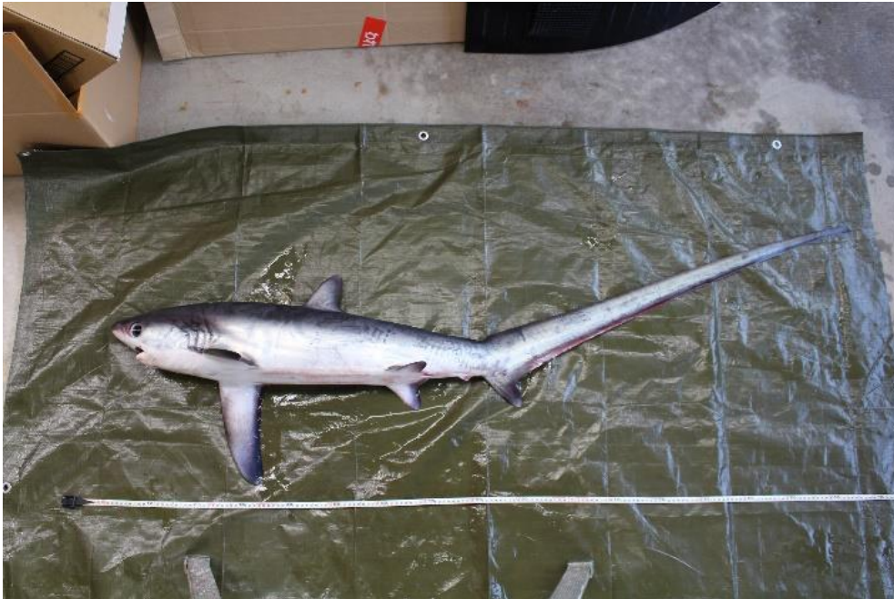
北川の定置網で混獲されたニタリ