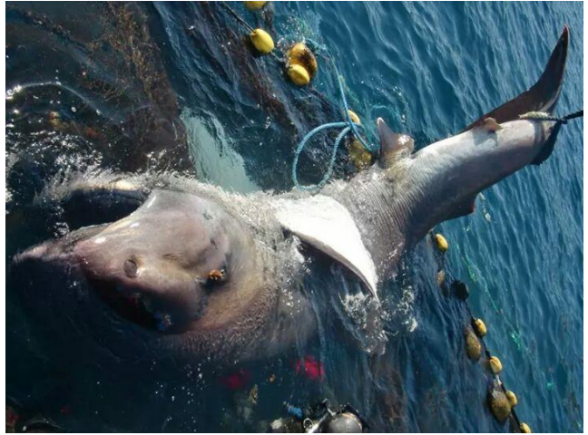
富戸の定置網で混獲されたメガマウスザメ