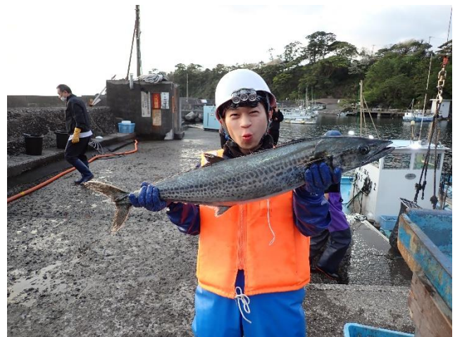
富戸定置網で水揚げされたサワラ