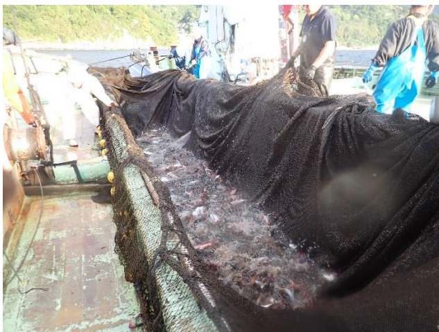
北川漁港の定置網漁の様子

定置網は定置網漁で使われる漁獲用の網のことです。巨大な網を海中に設置し、迷い込んだ魚を捕まえる漁法で、網は全長数百メートルにも及びます。魚を追いかけずに待つ「待ちの漁」であることが特徴で、季節により多種多様な魚種が漁獲されます。また、資源を使い尽くさない比較的環境にやさしい漁法としても知られ、江戸時代から続く伝統的な漁法として、日本の沿岸漁業を支えてきました。