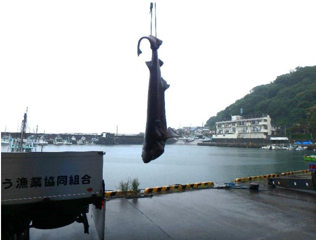
川奈の定置網で混獲されたカグラザメ

「サメは怖くて人を襲うもの……」そんなイメージをお持ちではありませんか。実は、人に危害を加えるサメはごくわずかです。サメは世界中の海で多様な暮らしをしており、私たちの食卓を支える「定置網」にも姿を見せます。「まるっと定置網展！」のトピックス企画として、定置網で混獲されたサメにスポットを当てます。定置網とサメの関係や、定置網で獲れる主なサメの種類などを解説し紹介します。この展示を通じて、サメについて新しい知識を一つでも持ち帰っていただければ幸いです。