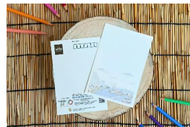
オリジナルフードロスペーパー（イメージ）