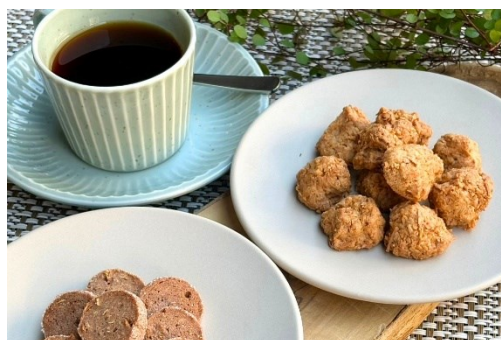
シェフ特製サブレ（イメージ）

また、ラウンジサービスの一環として厳選した数種類のコーヒー豆からお好みの一杯をお選びいただける、セルフドリップカウンターを新設いたします。併せて、朝食ビュッフェの土日限定メニューとしてご好評をいただいている「シェフ特製サブレ」もご提供いたします。自分だけの特別な一杯でコーヒーの新しい香りや味わいと“出会い・発見”を楽しみながら、こだわりの手づくりサブレで心がホッと安らぐひとときをお届けいたします。