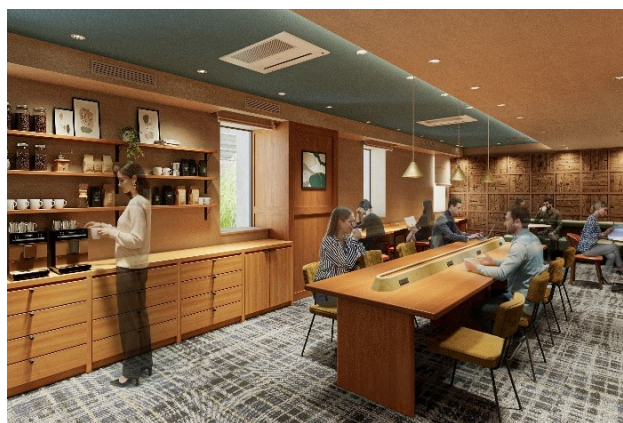
ご宿泊者専用ラウンジ（イメージ）

当ホテルが位置するのは、大学や企業オフィスが多く集まる日本有数のビジネス街、田町。かつては豊かな漁場が広がり、料亭や旅館が軒を連ねる花街として栄えました。今回のリニューアルでは、海と陸、人と文化、過去と現在が混ざり合ってきた街の歴史から「交」をコンセプトとして掲げ、訪れる人それぞれの時間や出会いが自然と重なり、そして交わり合う安らぎの場所を目指しました。