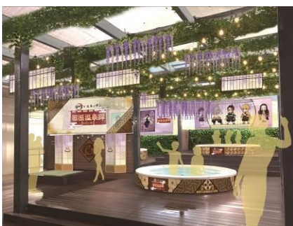
▲緑のテラス 「藤の花の湯場」イメージ

水着で遊べる温泉「ユネッサン」に、「鬼滅の刃」の世界観をたっぷり体感できる、コラボ風呂やコラボサウナが登場します。本イベント開催にあわせ、箱根小涌園を満喫するキャラクター5体 ufotable 描き下ろしイラストを使用したオリジナルグッズ付きコラボチケットも数量限定販売。隣接する箱根ホテル小涌園でもコラボルーム「鬼滅の刃ルーム」(1日1室限定)やコラボ宿泊プラン(数量限定)を販売するなど、世界観に浸る様々なコンテンツを展開します。