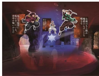
▲ロック ケーブ ONSEN 「無限城風呂」イメージ