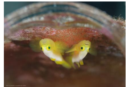
▲「沖縄に住む魚たち写真展」イメージ