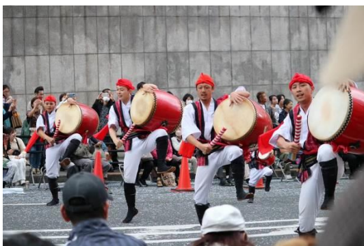
▲「桜風エイサー琉球風車」

ユネッサン公式 HP: https://www.yunessun.com/tamatebako/detail/?CN=428090