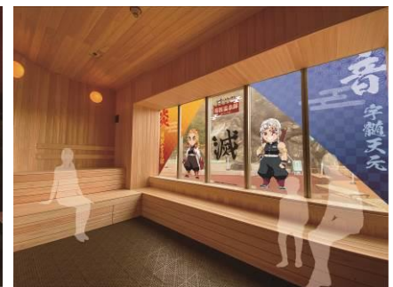
▲フィンランドバス 「藤の花の蒸気浴」イメージ