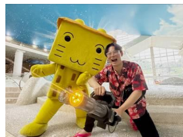
▲「ボザッピーのクールダウンミッション！」 イメージ

※イベント内容、営業体制は変更となる場合がございます。最新情報は公式HPをご確認ください。