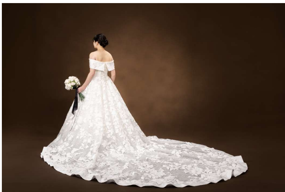
(ハツコ エンドウ ウェディングス限定オリジナルドレス)