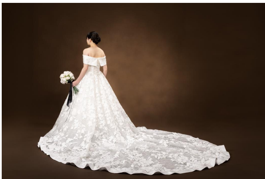
(ハツコ エンドウ ウェディングス限定オリジナルドレス)