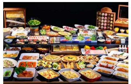
▲箱根ホテル小涌園ディナービュッフェ