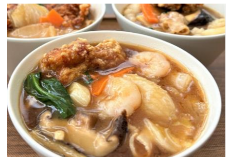
▲小涌園 ハコネコ亭「小涌園ラーメン」