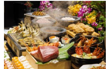
▲箱根小涌園 天悠ディナービュッフェ

【13時から楽しめる元湯 森の湯+縁日参加券+箱根ホテル小涌園ディナービュッフェ】