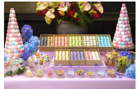
▲マカロンステーション