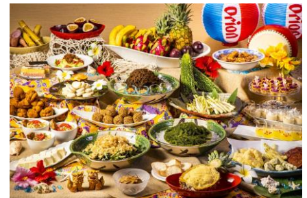
▲箱根小涌園 天悠ディナービュッフェ(沖縄フェア)