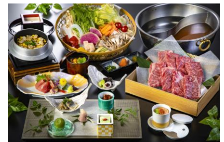
▲箱根小涌園 三河屋旅館 夕食和洋会席料理