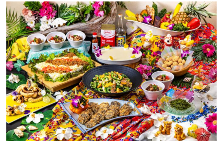
▲箱根ホテル小涌園ディナービュッフェ(沖縄フェア)