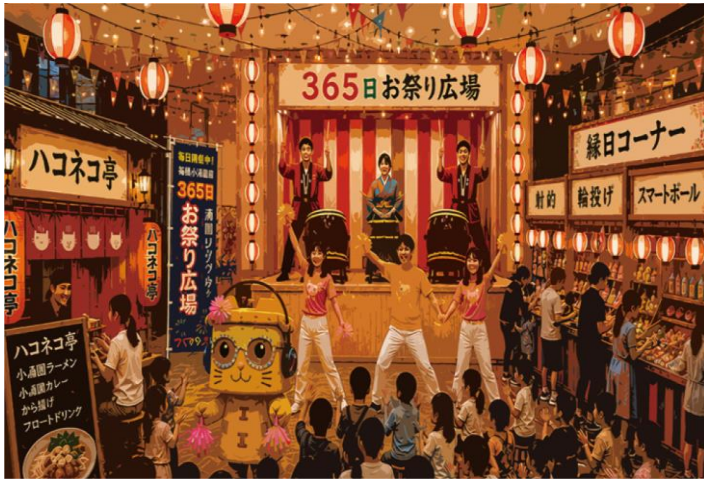
《365日お祭り広場イメージ》