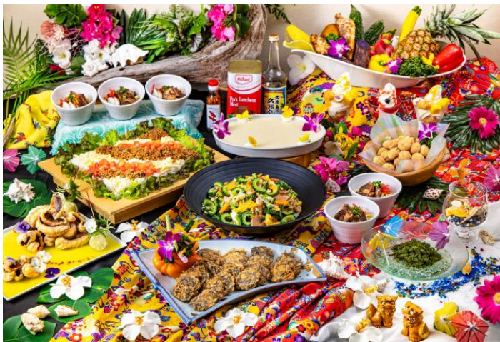
《ホテル小涌園沖縄フェア料理一例》