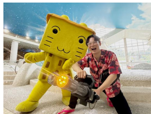
▲「ボザッピーのクールダウンミッション」イメージ