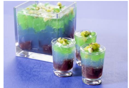
朝食ビュッフェ 「カクテルゼリー」

イベントのメインカラーである青・黄色をイメージした爽やかなカクテルが 特別コースメニューとして、夜のひとときを演出