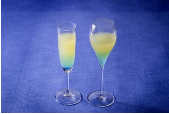
「TOKYO LIGHTS/TOKYO LIGHTS (Non-Alcoholic)」 MANHATTAN TABLE/鉄板焼 ふじた

WHG新宿（新宿ワシントンホテル 本館・ANNEX（別館）・ホテルグレイスリー新宿、所在地：東京都新宿区、総支配人：和田 修治）は、東京都庁第一本庁舎および新宿中央公園（西新宿エリア）で開催される夜の光の祭典「TOKYO LIGHTS 2026」（会期：2026年5月23日（土）～5月31日（日））とタイアップし、同イベントをイメージしたオリジナルメニューを2026年5月1日（金）～5月31日（日）の期間限定で販売いたします。