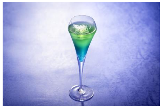
「Luminous TOKYO」 GRACERY LOUNGE

「TOKYO LIGHTS 2026」は、西新宿の東京都庁第一本庁舎および新宿中央公園を舞台に、光とアートが融合する体験型エンターテインメントです。イベント開催期間中は、世界のクリエイター作品が上映される「プロジェクションマッピング国際大会」や、国内外の12作品（予定）が集結する光のアートパーク「Light Art Park」など、来場者へ新たな新宿の夜の体験をお届けいたします。