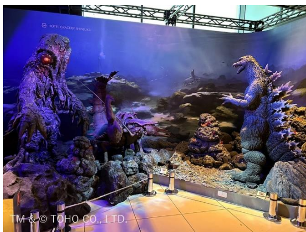
2026 年第一弾ジオラマ全景

ホテルグレイスリー新宿（東京都新宿区、総支配人：和田修治）は、東宝株式会社の「ゴジラ」作品のジオラマを新たに 2 月 1 日（日）から 6 月 30 日（火）まで 8 階ロビーに設置いたします。当ジオラマ展示は、ご来館いただくお客さまに存分にお楽しみいただけますよう、本年 2 期に分けて実施を予定しており、第二弾のジオラマは 6 月下旬～12 月まで展示を行います。