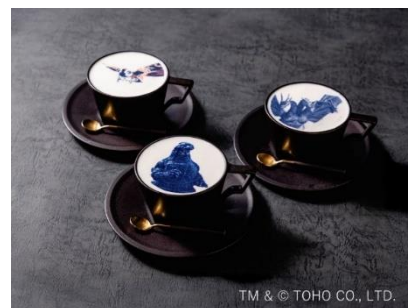
ゴジラプリントアートラテ