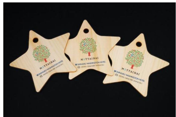
チャリティーオーナメント

今回初めての取り組みとなるチャリティーオーナメントは、環境に配慮した国産ヒノキの間伐材を使用し、自然の温もりを感じられるデザインに仕上げました。オーナメントには願いごとを書き込むことができ、ご購入後はロビーに設置したクリスマスツリーに飾っていただくか、お持ち帰りいただきご自宅のツリーやお部屋のインテリアとしてもお楽しみいただけます。皆さまの想いがツリーを彩ります。