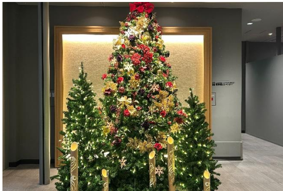
新宿ワシントンホテル 本館 ツリー

WHG 新宿（新宿ワシントンホテル／ホテルグレイスリー新宿、所在地：東京都新宿区、総支配人：和田 修治）は、2025 年 12 月 2 日（火）より、環境保護と社会貢献を目的としたクリスマスチャリティーオーナメント（1 個 500 円/税込）の販売を開始いたします。また、新宿ワシントンホテル ANNEX（別館）1 階「鉄板焼 ふじた」では、12 月 19 日（金）から 12 月 25 日（木）までの期間限定でクリスマスディナーコースを提供いたします。