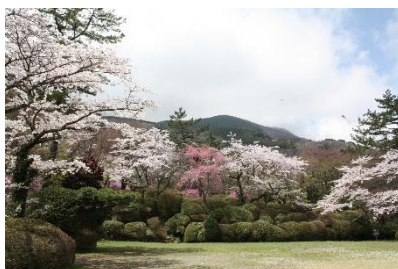
箱根小涌園 蓬萊園