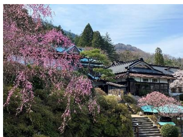
箱根小涌園 三河屋旅館