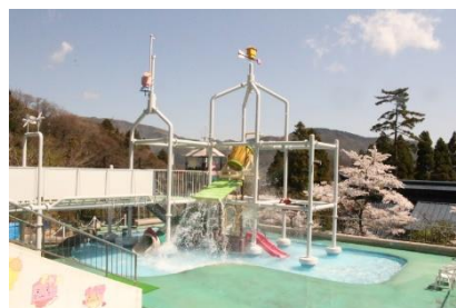
ユネッサン / ボザッピのジャングルジム