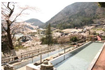
ユネッサン / 超絶景 展望露天風呂