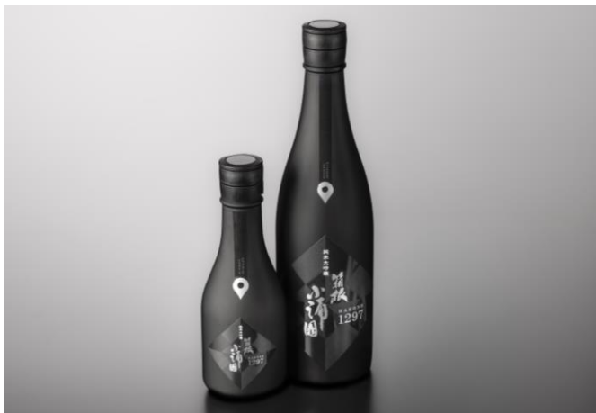
<純米大吟醸 箱根小涌園 HAKONE1297>