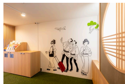
※本リリースの画像はイメージです。