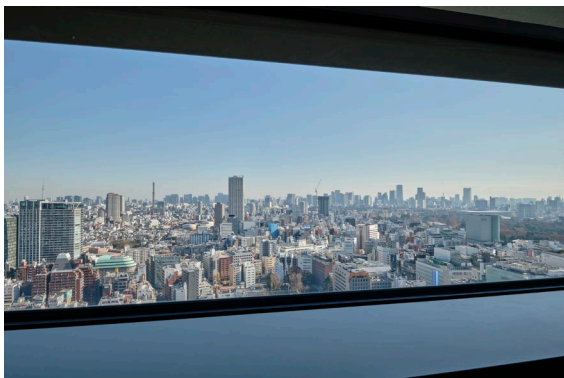
30階客室からの眺め※お部屋により見え方は異なります