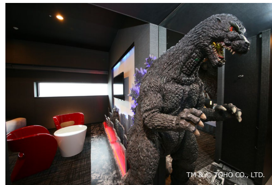
1室限定のゴジラルーム