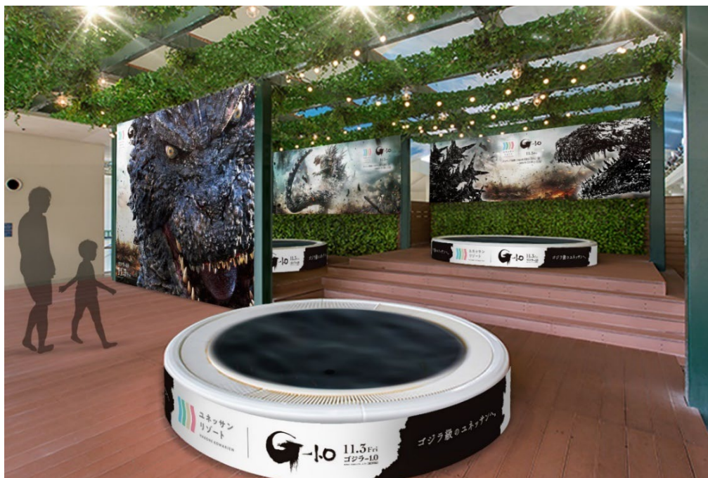
「ゴジラ風呂」イメージ

ススキから紅葉、そして温泉の恋しくなる季節を迎える箱根路を、“ゴジラ級なユネッサン”とともに楽しみください。