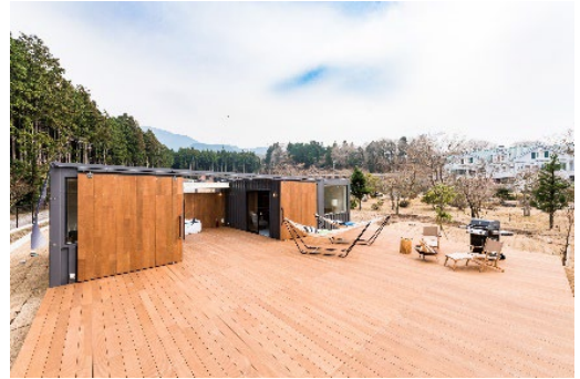
独立型キャビン「スイートキャビン」

藤乃煌 富士御殿場は都心から約1時間半、全客室から富士山の眺望が楽しめるグランピング施設。プライベート感を重視した独立型キャビンとドーム型テントがあり、ホテルのような快適な客室での滞在と豪快な食事とともにアウトドア体験をお楽しみいただけます。