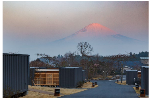
藤乃煌 富士御殿場から見る富士山

公式ホームページ https://www.fu-ji-no.jp/kirameki/