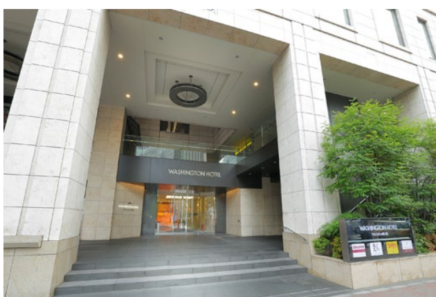
秋葉原ワシントンホテル