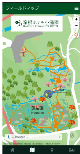
フィールドマップ