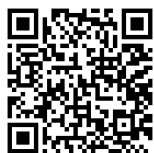
日本庭園ガイド 二次元バーコード