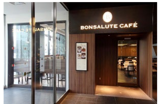
ボンサルデー・カフェ

今回の企画を皮切りに、今後も皆さまにお楽しみいただける企画を実施予定です。皆さまのご来店を心よりお待ちしております。