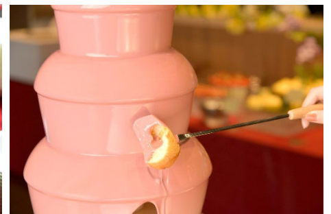
ルビーチョコレートファウンテン

今から 50 年前の 1973 年 6 月 20 日、ホテルグレイスリー札幌の前身であり、藤田観光直営ワシントンホテルの第一号店である「ホテルワシントン札幌」が開業いたしました。このたび、開業 50 周年を記念して、日頃のご愛顧に感謝を込めて本企画を開催いたします。