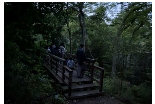
▲ほたるを鑑賞するお客様の様子