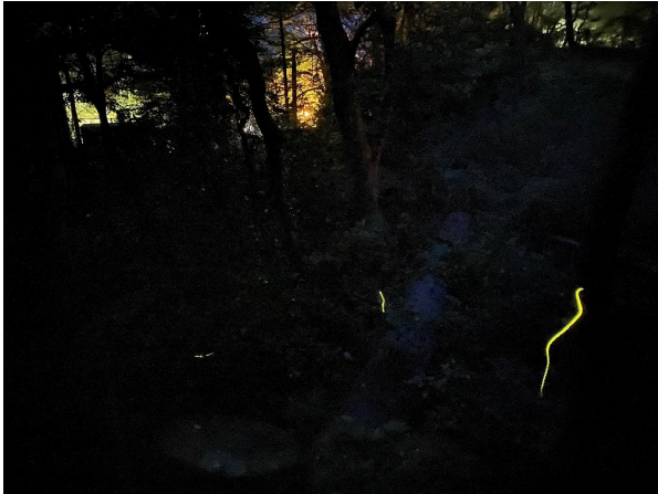
▲過去のほたる飛翔の様子