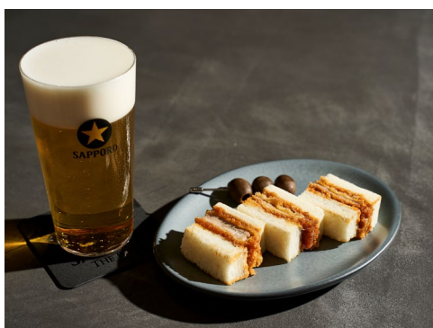
【『パーフェクト黒ラベル』と『銀座サンド』】

所在地 : 東京都中央区銀座 4-6-16 銀座三越 新館(入場受付 : 新館 9 階) 営業時間 : 10 : 00-19 : 00 定休日 : 銀座三越の休館日に準ずる (加えて、メンテナンス等により不定期で休館の場合がございます。詳しくは公式サイトをご確認ください。)