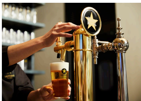
【サッポロ生ビール黒ラベル THE BAR】