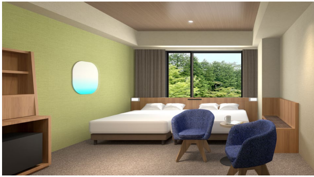
【スタンダードルーム Type-A】

客室は、どなたでも過ごしやすいように全室にベッドを配置。また、ゆっくりお寛ぎいただけるよう、靴を脱ぐタイプの客室もご用意しております。