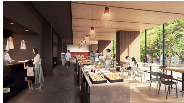
【ビュッフェレストラン】

客室は、どなたでも過ごしやすいように全室にベッドを配置。また、ゆっくりお寛ぎいただけるよう、靴を脱ぐタイプの客室もご用意しております。