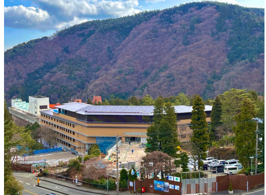
【建設中のホテル（1月27日撮影）】

長年親んでいただいた「箱根ホテル小涌園」の名称を受け継ぎ、『ユネッサンと一体的に「温泉」「自然」「食事」を体験できるホテル』というコンセプトのもと、様々な温泉、自然の美しさや文化に触れる体験など、癒しの時間をご提供いたします。