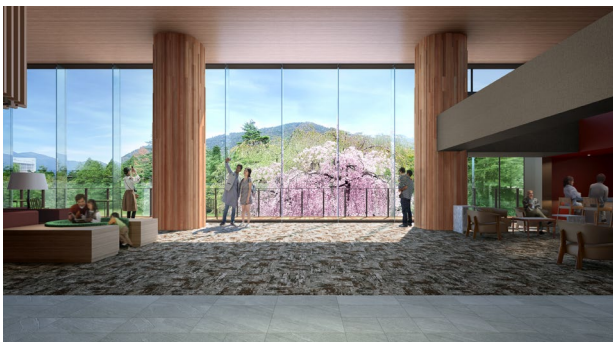
【庭園・箱根外輪山を望むロビー】

新ホテルでは、キャッシュレス決済の導入やセルフチェックイン機の設置等、お客さまの利便性向上に取り組み、より気兼ねなく快適にお過ごしいただける次代のリゾートホテルを目指してまいります。