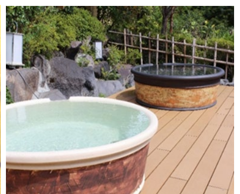
元湯 森の湯 陶器風呂