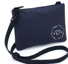
『キタムラ』の「ヨルノヨオリジナルサコッシュ」

横浜ベイエリアの各所に設置された神秘的なイルミネーションを巡り、撮影したとっておきの一枚で是非奮ってご参加ください。