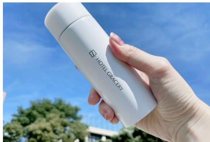
ロゴ入りオリジナルエコボトル