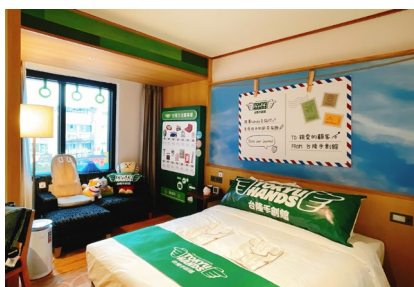
「HANDS と旅行へ行こう」ルーム (ハンズルーム)