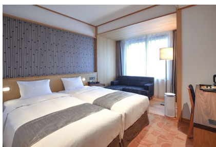
ハリウッドツインルーム