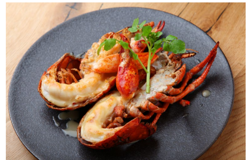
オマール海老のロースト（上）・俺のフレンチ東京店内（下）