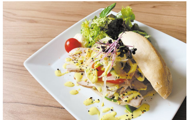
ホテルオリジナル「自家製サラダ鶏ハムとモッツアレラのバーガー」