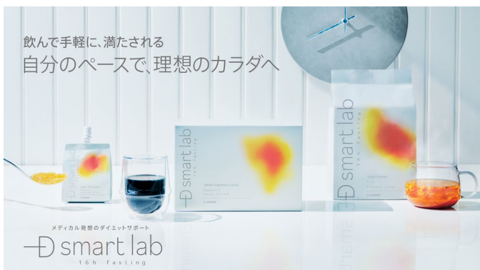
ダイエットサポートブランド「D smart lab」の商品3種

※2…「健康に、痩せる」メディカルダイエットをコンセプトとした、外来の医師や管理栄養士からなるチーム