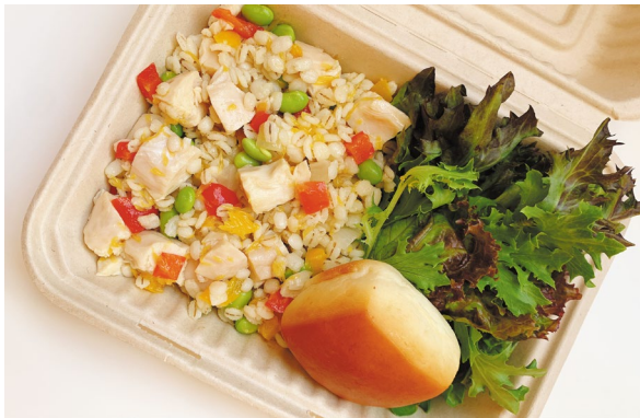
特別メニュー「押し麦・鶏ささみ・オレンジのサラダ」

② 上記特別メニュー以外をご希望の方には、ホテルオリジナルバーガー「ヘルシー版」をホテル1階レストラン「ボンサルーテ」にてご用意いたします（営業時間 7:00～10:00）