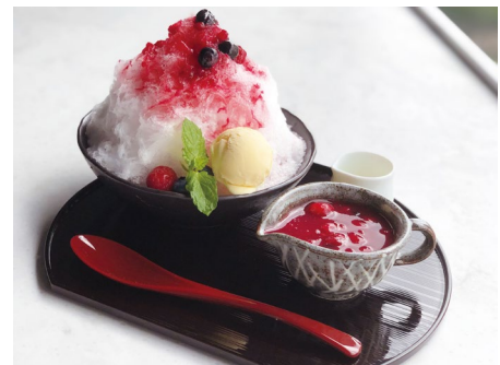
ベリー&練乳のかき氷 ¥1,210（税込）

【店舗 URL】 https://www.shinjyuku-wh.com/restaurant/bar_baron.html