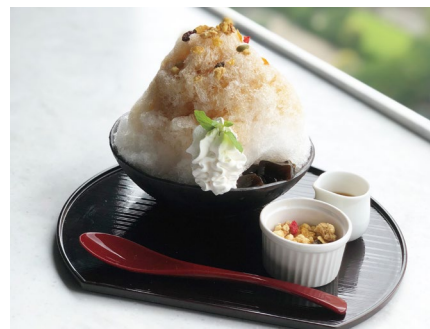
コーヒー&キャラメルのかき氷 ¥1,210（税込）

暑い季節の強い味方となるバロンの夏のかき氷は「ベリー&練乳」「抹茶&きな粉」「マンゴー&練乳」「コーヒー&キャラメル」の4種の味をご用意いたします。かき氷はすべてシェフ特製の手作りシロップを使用しています。中でも一押し「コーヒー&キャラメル」は、バロンこだわりのコーヒーをかき氷に合う風合いに仕上げました。トッピングのグラノーラと氷の食感が良く、さらにシロップと混ぜる事で口の中に豊かなコーヒーの香りが広がります。