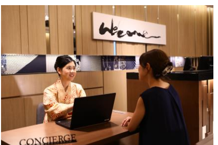
英語でチェックイン体験