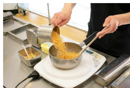
雷おこしづくり体験