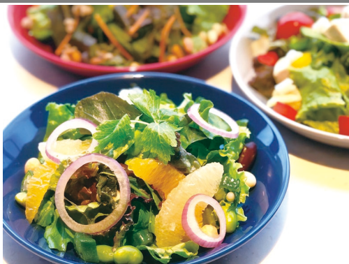
夏仕立てのシトラスサラダ（Sサイズ ¥440〜）