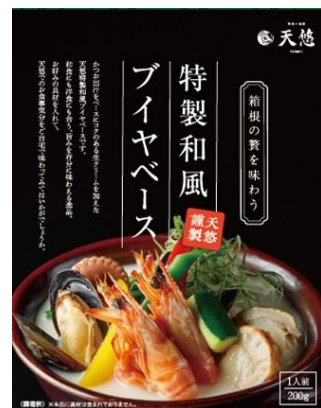
天悠特製和風ブイヤベース