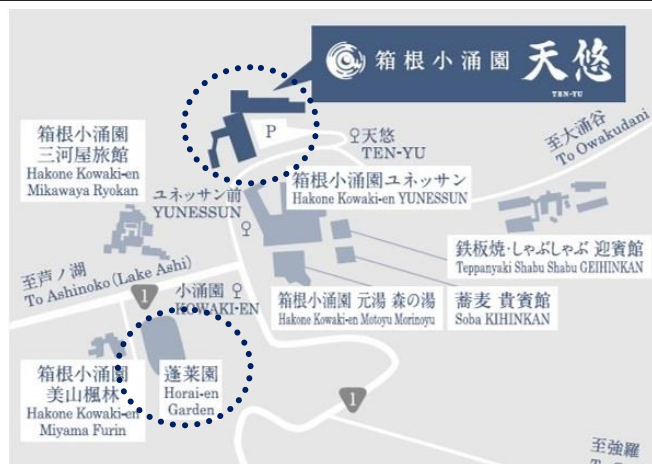
▲天悠と蓬萊園の位置関係

箱根小涌園 天悠（所在地：神奈川県足柄下郡箱根町二ノ平 1297、支配人：柴田 訓 以下、天悠）から徒歩約10分の場所に位置する箱根小涌園 蓬萊園（はこねこわきえん ほうらいえん）（所在地：神奈川県足柄下郡箱根町小涌谷 503 以下、蓬萊園）では6月2日にほたるの飛翔を確認いたしました。蓬萊園で見られるほたるは自生しているほたるになり、今年は例年より飛翔量が多いように見受けられ、訪れるお客様の目を楽しませています。天悠ではご宿泊のお客様に蓬萊園のほたる鑑賞を楽しんでいただけますよう、期間限定の「天悠ほたる鑑賞プラン」をご準備いたしました。また、温度や気象条件によっては鑑賞できないこともあるため、ご覧になれなかった場合は「天悠特製和風ブイヤベース」をお土産としてお渡しいたします。