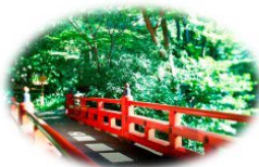
散策できる自然豊かな庭園