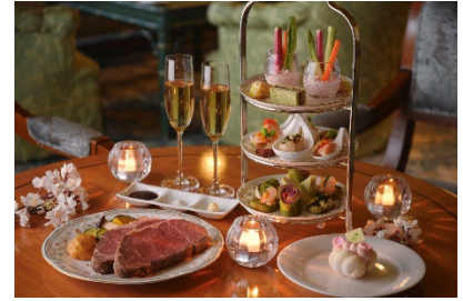
※料理イメージ画像