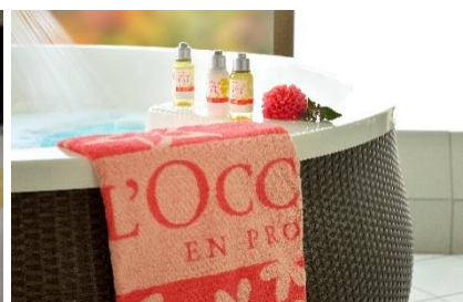
スペシャルプレゼント for バスタイム