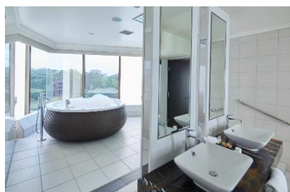
ビューバススイート