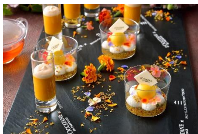
金木犀のムーンデザートと かぼちゃのプディング