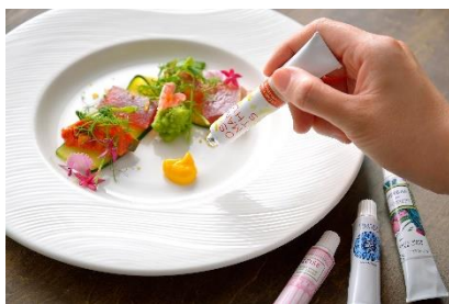
マグロとラタトゥイユのオードブル 〜ハンドクリームのようなシェフ特製ソース〜

■URL : https://hotel-chinzanso-tokyo.jp/event/plan/loccitane_event2021/