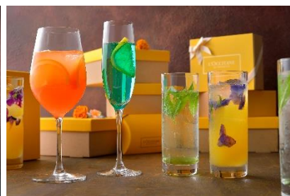
オリジナルカクテル4種