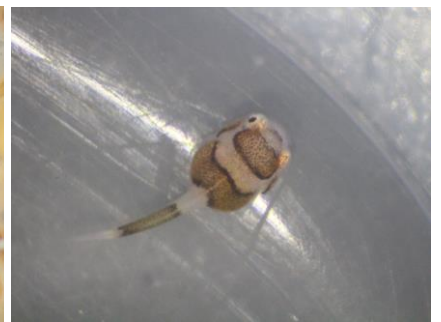
左：親個体 中：卵 右：孵化仔稚魚（天使の輪）