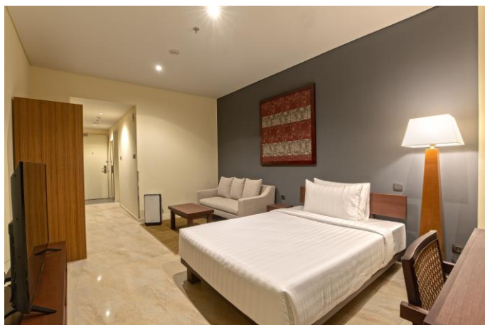
【デラックスルーム】