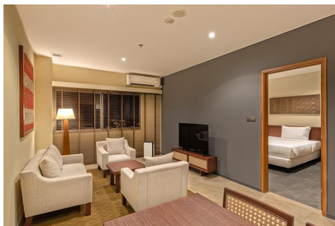
【エグゼクティブルーム】