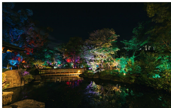
七色に光り輝く鏡の池 (イメージ)

年間約30万人が訪れる由志園は、大輪の牡丹や四季折々の花が鑑賞できる池泉回遊式の日本庭園です。日本庭園ランキングにも選出されるなど島根県を代表する日本庭園として広く知られています。太閤園とは調理部門と料飲サービス、庭園管理の分野において約3年前から技術交流を図っています。