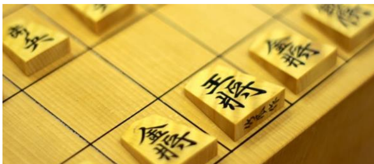
上段左：佐藤 天彦名人 上段右：「鰻丼」 下段：将棋イメージ