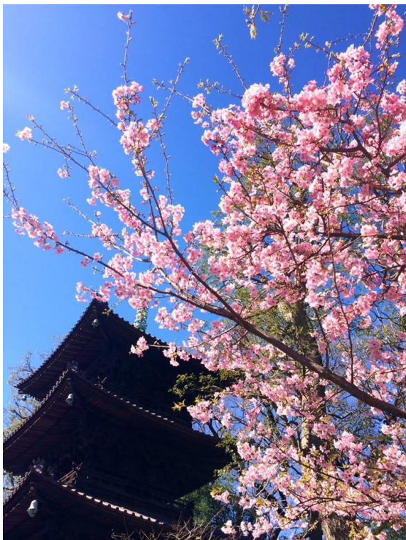
三重塔と2月に見頃を迎える河津桜