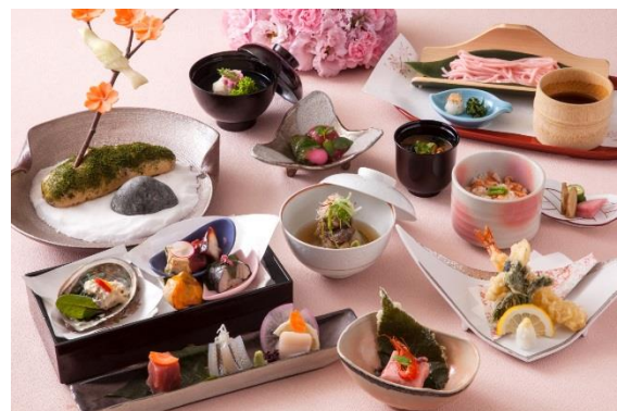
上 イタリア料理「イル・テアトロ」、下 日本料理「みゆき」