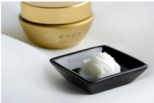
「極上フェイシャル euga Geneous」

またゴールデンウィーク期間中に、ご家族でお楽しみいただける「ゴールデンウィーク コンサート&buffet」や、お1人様からでもご参加いただける「体験型ストーリーイベント」など様々なイベントを開催します。少し早めですが、母の日としてお子様のいらっしゃるママに、「コト」のプレゼントもお勧めです。