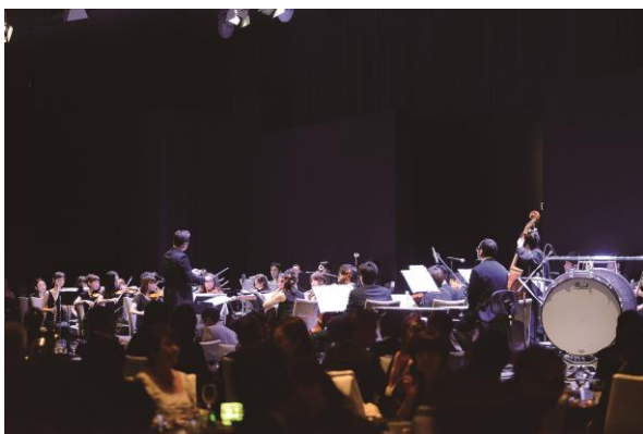
「ゴールデンウィーク コンサート&buffet」