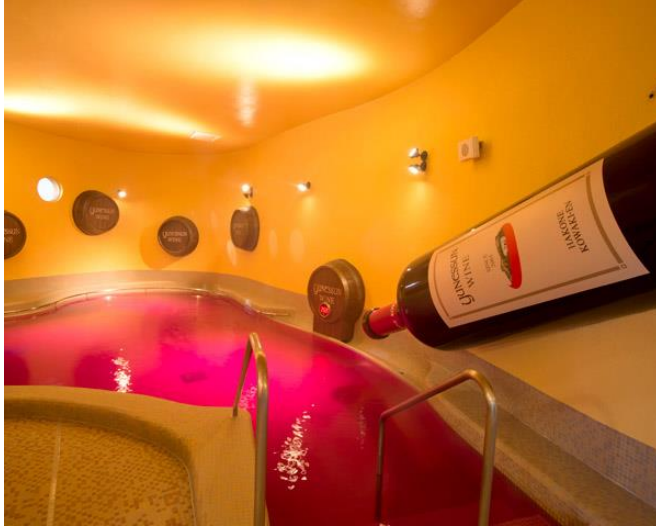
▲ワイン風呂(水着入浴)