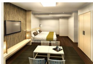
コンセプト-2 「和モダン」