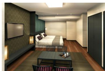
コンセプト-3 「隠れ家風」