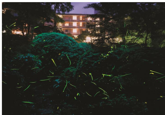
(ほたる舞うホテル庭園内「ほたるの里」)